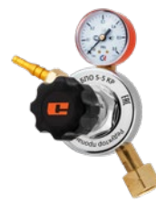
БПО-5-5 KP крупногобаритный

Редукторы БПО предназначены для понижения и регулирования давления газа, поступающего из баллона, и автоматического поддержания постоянного рабочего давления. Пропановые редукторы изготавливаются с одним манометром, показывающим рабочее давление газа.