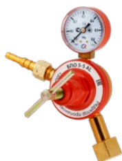
БПО-5-5 AL крупногобаритный