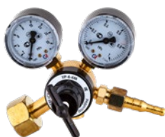
УР-6-6 М малогабаритный