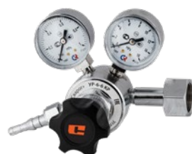
УР-6-6 КР крупногабаритный

Редукторы УР предназначены для понижения и регулирования давления газа, поступающего из баллона, и автоматического поддержания постоянного рабочего давления. Углекислотные редукторы позволяют работать с большими объемами, обеспечивая при этом точность настройки при длительной работе. Углекислый газ часто используется при механизированной сварке MIG/MAG и в других областях. В редукторах установлен предохранительный клапан, соединенный с рабочей камерой, который обеспечивает дополнительную безопасность при работе с газом.