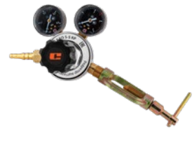
BAO-5-5 KP крупногабаритный

Редукторы БАО предназначены для понижения и регулирования давления газа, поступающего из баллона, и автоматического поддержания постоянного рабочего давления газа. Ацетилен является легковоспламеняющимся газом, и в целях безопасности ацетиленовые редукторы крепятся к газовым баллонам накладными хомутами специальной конструкции.