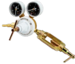
BAO-5-5 AL крупногабаритный